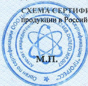
СХЕМА СЕРТИФИКАЦИИ 1с (ГОСТ Р 53603-2020. Оценка соответствия. Схемы сертификации продукции в Российской Федерации).